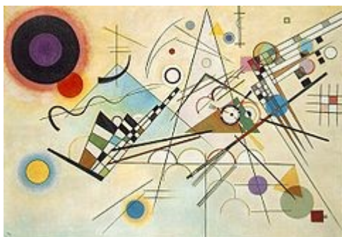
Composición 8 , Kandinski 1923. Museo Guggenheim, New York.

En De lo Espiritual en el Arte , habla de una nueva época de gran espiritualidad y de la contribución de la pintura a ella. El arte nuevo debe basarse en un lenguaje de color y Kandinski da las pautas sobre las propiedades emocionales de cada tono y de cada color, a diferencia de teorías sobre el color más antiguas, él no se interesa por el espectro sino sólo en la respuesta del alma.